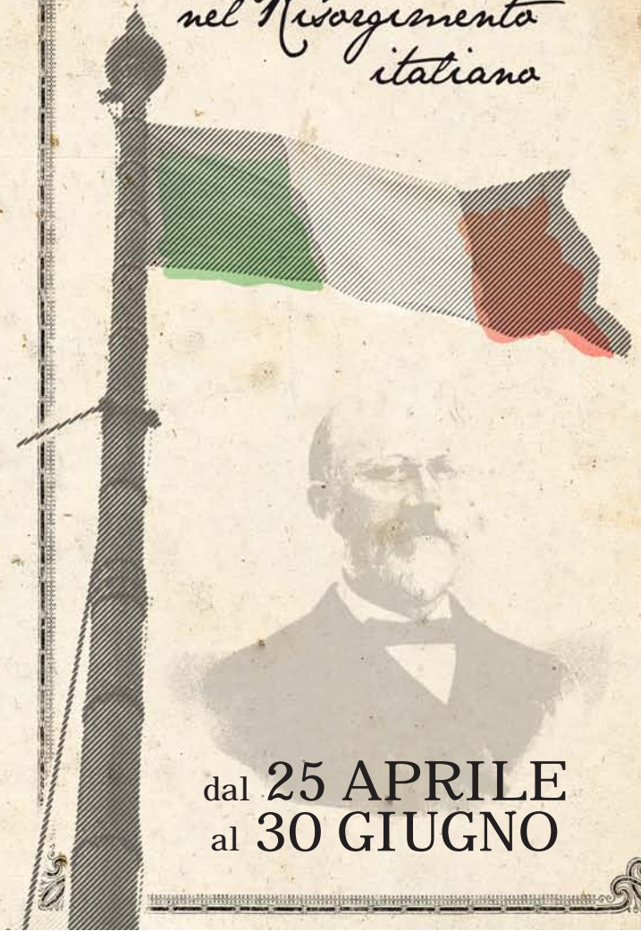
Figura significativa nel Risorgimento italiano